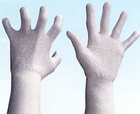
プロテクトグローブ