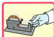
③ストッパーをくぐらせ カッターで切れば完了