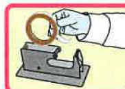
①テープを少し出します