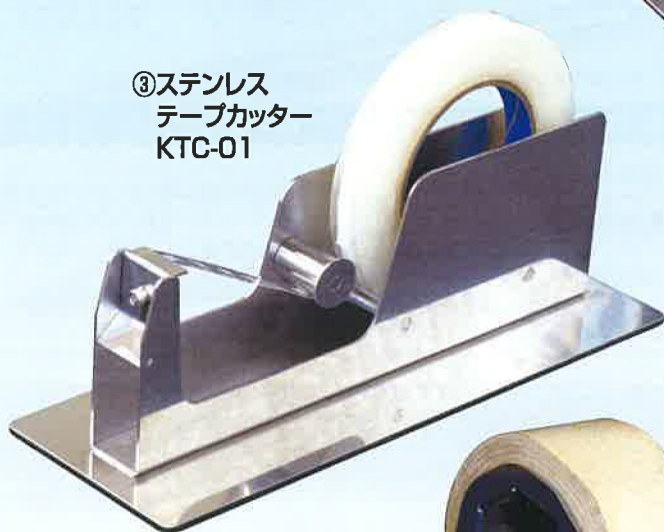
③ステンレステープカッター KTC-01