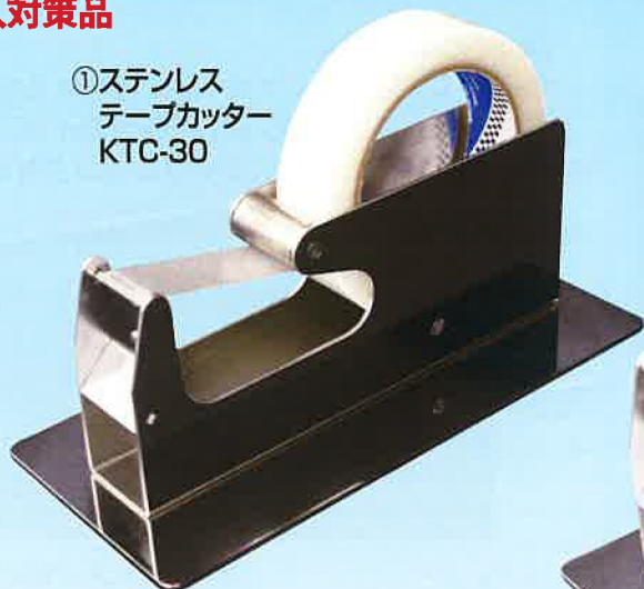
①ステンレステープカッター KTC-30