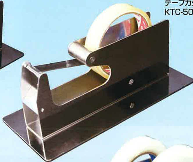
②ステンレステープカッター KTC-50