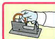
②テープを本体に入れます