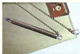
ステンレスボールチェーン