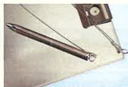
ステンレスワイヤー

上記画像のようにステンレスボールチェーン又はステンレスワイヤーにてボールペンをセットすることにより、紛失や異物混入を防止します。